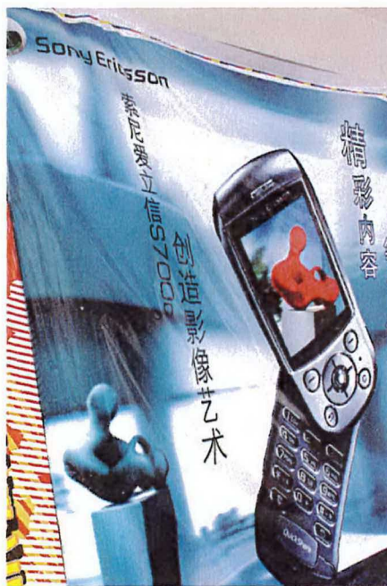
En telefon för fattig som för rik? Kina är en av Sony Ericssons snabbast växande marknader.

De fattiga länderna i världen har stora skulder till de rika länderna. Många anser att det är nödvändigt att delar av lånen avskrivs så att de fattiga länderna inte behöver betala tillbaka allt de lånat.