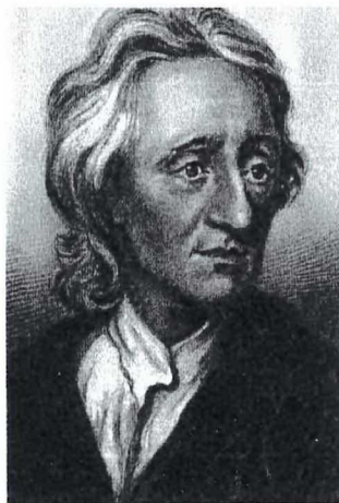
I sin mest kända bok, Two Treatises of Government , försöker John Locke bland annat förklara vilka rättigheter medborgarna och de styrande har mot varandra.

De idéer som Locke förde fram bygger på att människan, enligt naturrätten , har vissa grundläggande rättigheter. Vi har rätt till vår person, vår kropp och vårt liv, och får göra allt som krävs för att skydda den rätten. Dessutom har vi rätt till våra åsikter – åsiktsfrihet – samt rätt till privat egendom. De här rättigheterna gäller även om vi skulle leva i en värld utan några stater, poliser och lagar, i ett så kallat naturtillstånd .